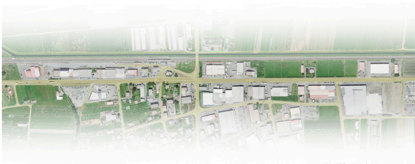
Séquence Charrat, nomad, 2021