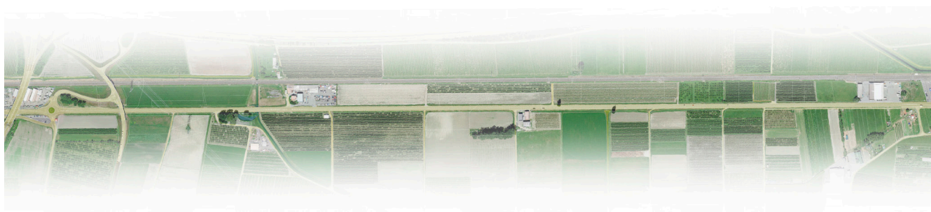
Séquence Plaine agricole, nomad, 2021