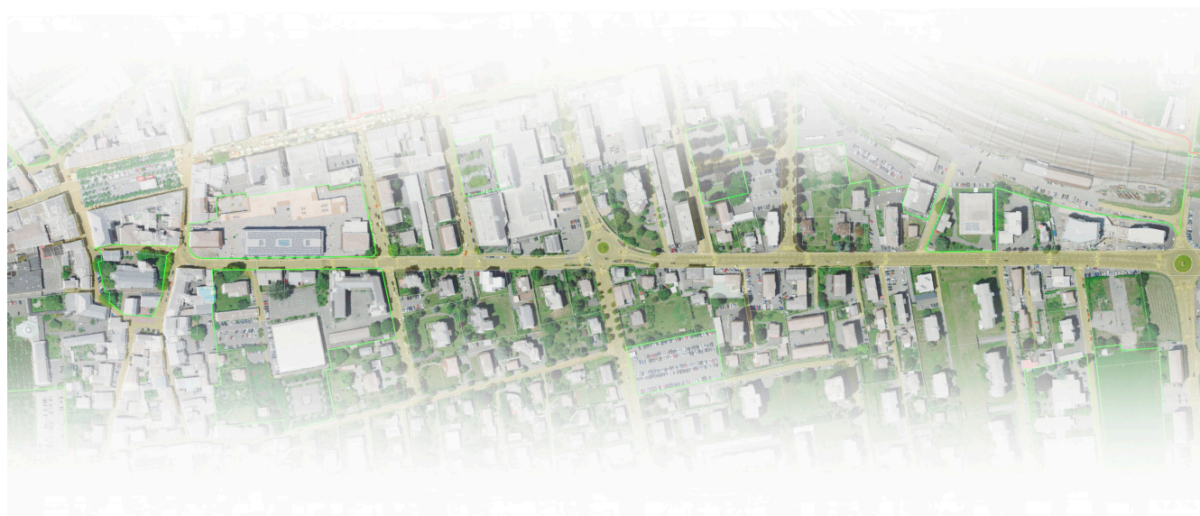
Séquence Centre-ville, nomad, 2021.