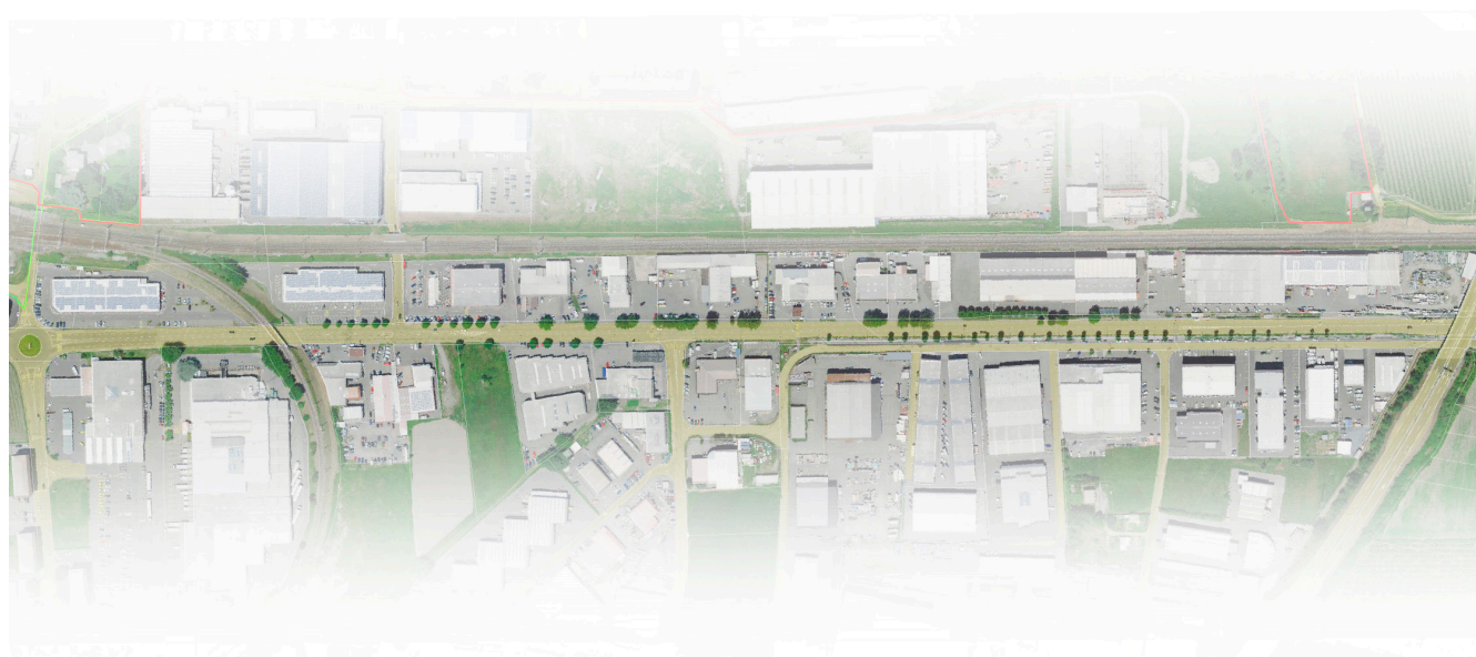
Séquence Zone d'activités, nomad, 2021.